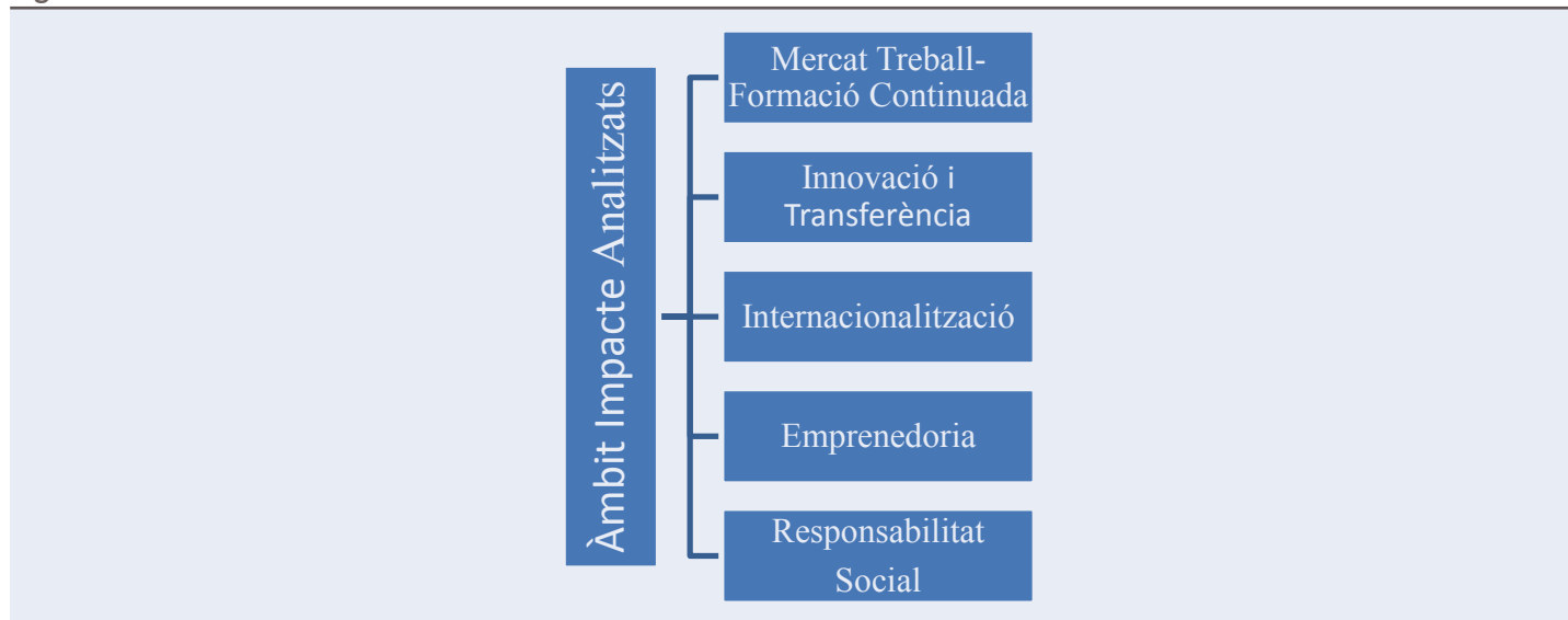
Figura 1. Àmbits d'atenció